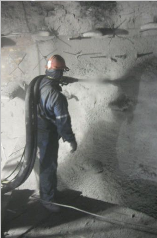
Alto Horno Acerias Paz del Rio- 2011