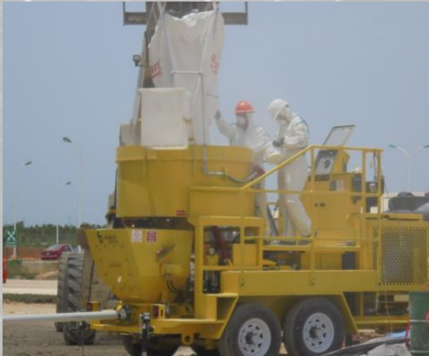
Mezcladora con bomba para proyeccion de concreto para sistema shotcrete