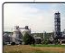
Holcim Rumania- Campulung- Consorcio