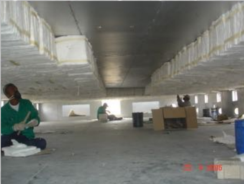
Reformador primario ABOCOL Cartagena 2008